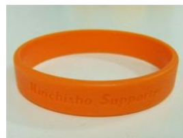
受講の証 オレンジリング

認知症についてもっと理解を深めたいと思われる方は、玉出地域包括支援センターまで連絡ください。