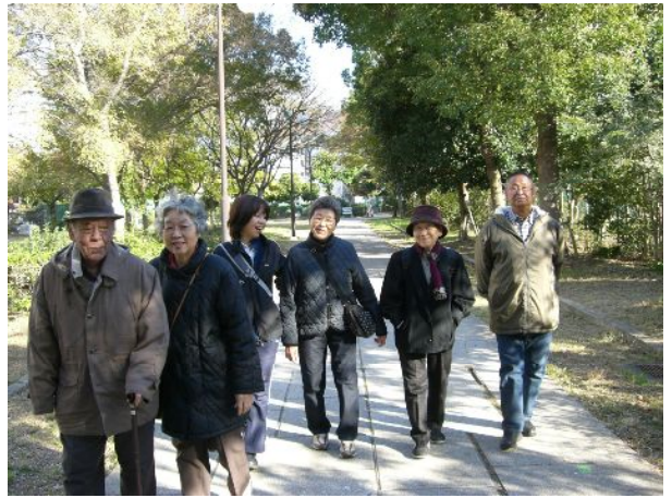
はつらつウォークで南港に行きました！

今回は、『紅葉をみながら歩きましょう!!』という事で、木々の豊かな南港ポートタウン内を散策しました。今年は気温が高かったため、残念ながら例年に比べて紅葉は少なかったのですが、参加者の皆さんは『緑がいっぱいで、鳥のさえずりが聞こえて、なんか遠くまで来たい・・』と喜んでいただき、7000歩も歩きました。来年、桜の咲く季節に、歩きたいと思います。みなさんも一緒にどうですか？