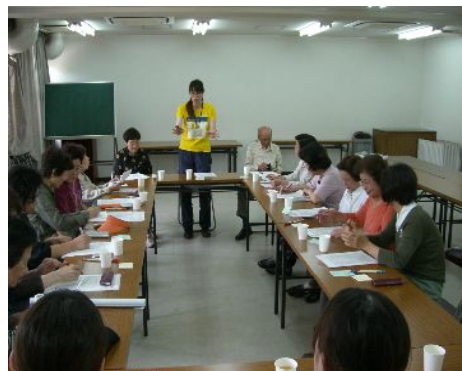
地域の高齢者について一緒に話し合い

ご近所をよく知っているネットワーク委員さんと一緒に訪問するため、突然の訪問にも快くお話を聞いて頂き、改めて委員さんの日々の見守りの力を実感しています。玉出地域は高齢者の方が多く、全ての町会を訪問するには時間がかかりますが、ご近所とのつながりを大切にし、安心して暮らせるまちづくりができるような活動をこれからも続けていきたいと思えます。