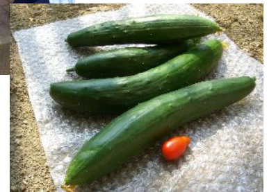
収穫したきゅうり