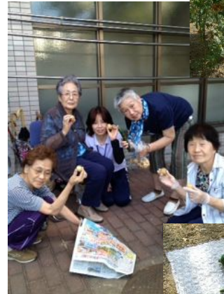
ジャガイモもとれました！