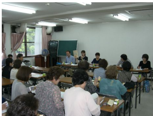
玉出地区ネットワーク委員 地域包括支援センターと 連携について説明

いつも地域包括支援センターの取り組みにご協力ありがとうございます。今後もよろしくお願ひします。 (報告：小野田)